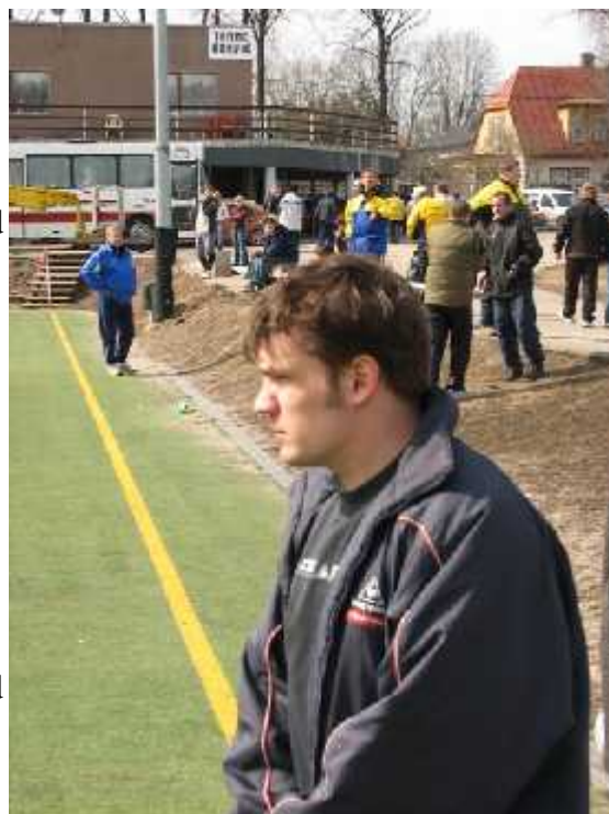
Ondatra kevadisel mängul Välk 494 vastu

Plaanipäraselt läks see, et jäime liigasse püsima ja suutsime kõigilt vastastelt punkte röövida. Valesti minekuks võib pidada isegi natukene seda, et tegime suisa 11 viiki, millest minu hinnangul oleksime olnud võimelised olnud võitma vähemalt 5-6. Aga eks neid viimaste minutite pääsemisi oli kah omajagu, nii et osa viike võib ka plaanipärasteks lugeda :P .